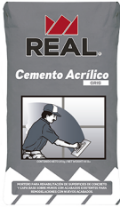
Saco de Cemento Acrílico GRIS