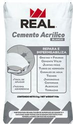
Saco de Cemento Acrílico BLANCO